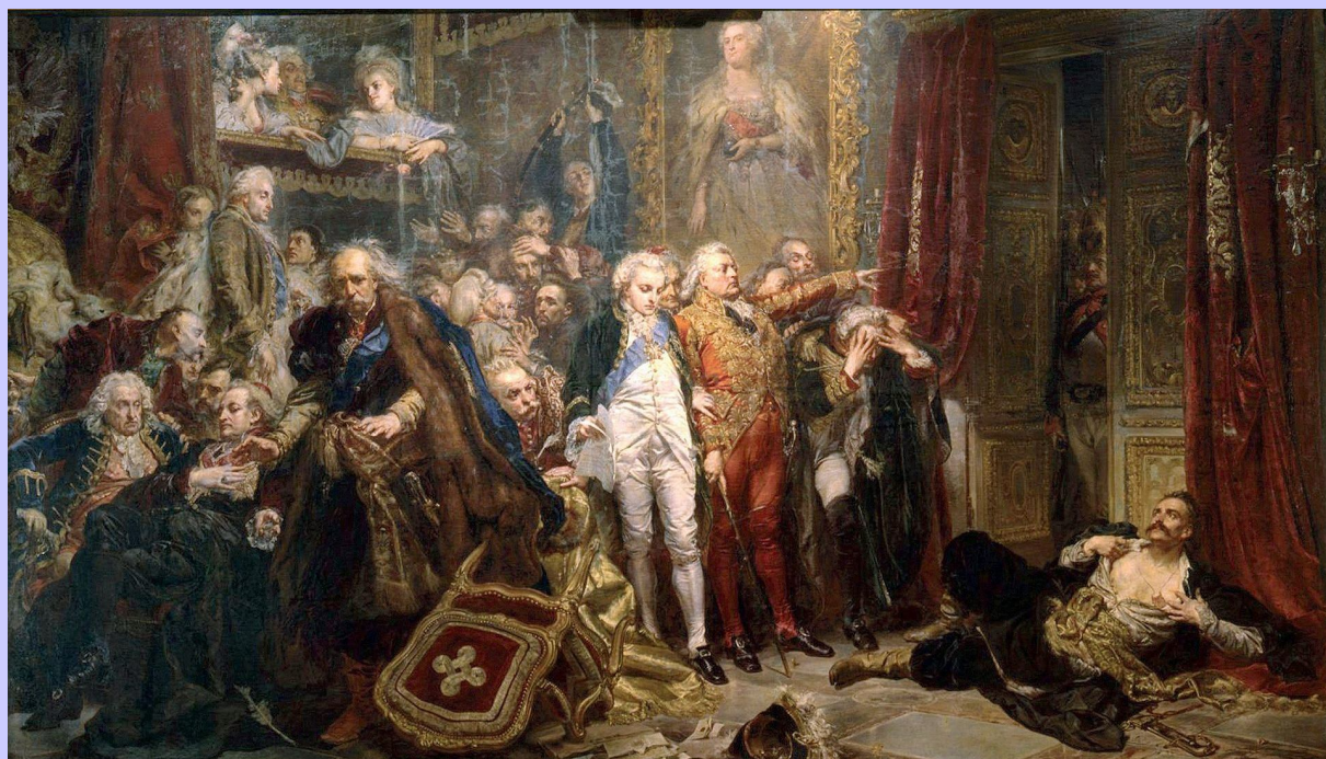
Obraz Jana Matejki pt. „Rejtan - Upadek Polski”

Nieodłącznym elementem architektury Krakowa jest Twierdza Kraków. Pierwotnie austriackie dzieła obronne wokoło Krakowa, a obecnie bogate lapidarium historii architektury obronnej, gdzie obok prawie kompletnej twierdzy austriackiej istnieją dzieła starsze – kościuszkowskie fortyfikacje z XVIII w., Wawel oraz średniowieczne baszty cechowe.